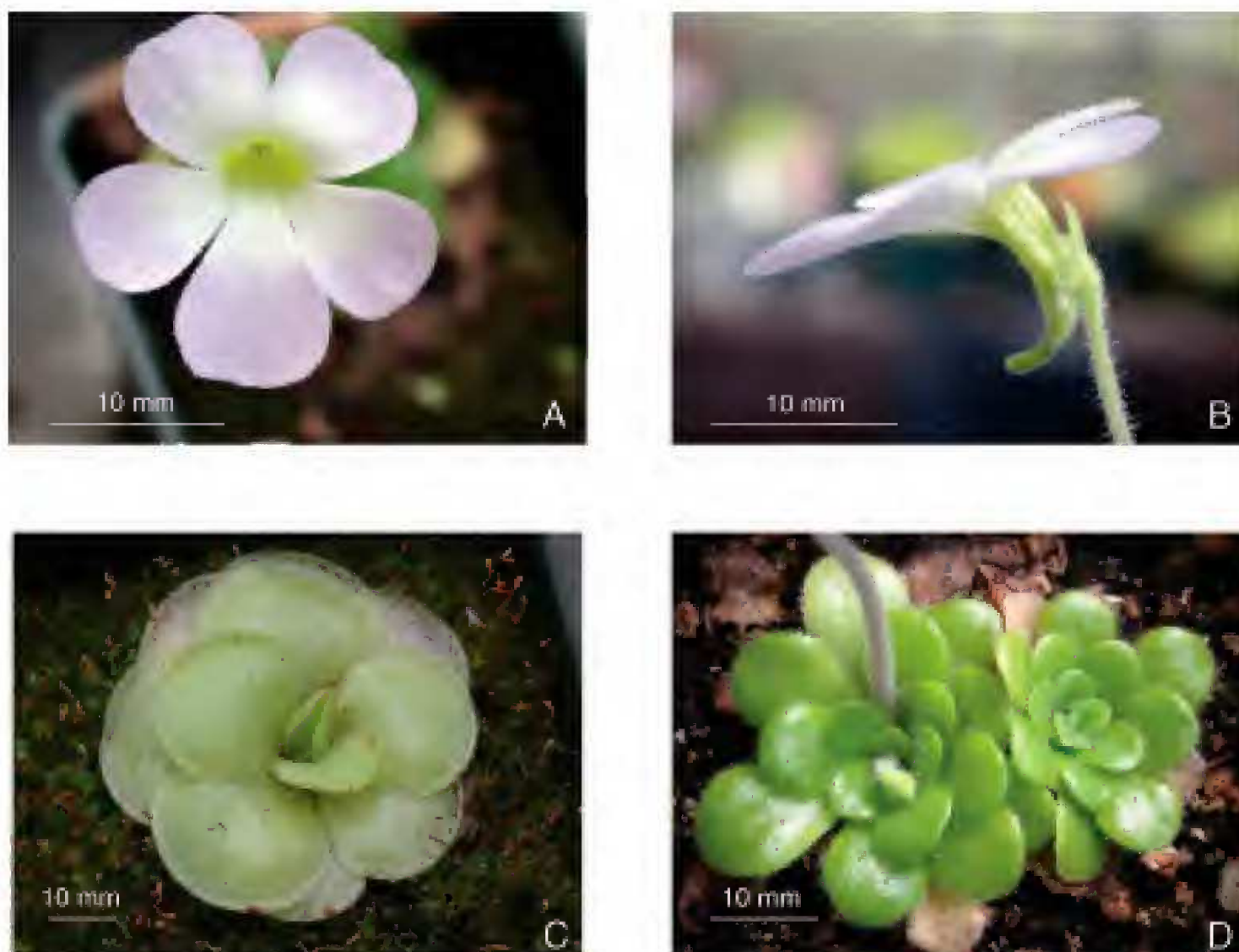
Fig. 3. Pinguicula pilosa Luhrs, Studnicka et Gluch. A. Flor vista de frente; B. Flor vista de lado, destaca el espolón corto y curvado y la pubescencia del pedúnculo y el cáliz formada por dos tipos de pelos; C. Planta con hojas de “verano”; D. Planta con hojas de “invierno”.

Con respecto a la roseta de “invierno”, en P. ibarrae tal estructura no se forma o se origina tardíamente dependiendo de la humedad prevaleciente en el ambiente; mientras que en P. pilosa la producción de rosetas de “invierno” es constante.